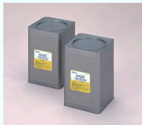
10 kg 装 (无罐钢罐)